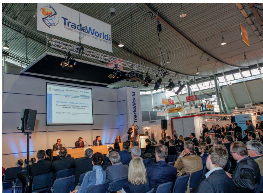
Forum TradeWorld: Großes Interesse für E-Commerce und andere Handelsformen.