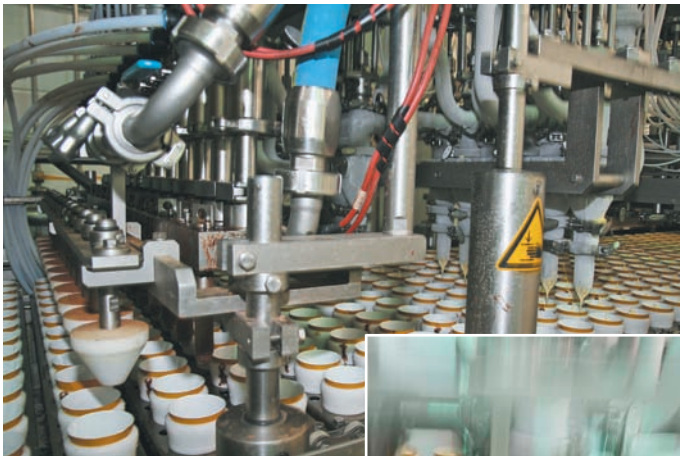
Die zwölfköpfige Füllstation

IFS (International Food Standard) zertifizierten Produktionsstätten tragen ungefähr in gleichem Maß zum Eiscreme-Umsatz bei, wobei Everswinkel in etwa 70 Prozent der jährlichen Gesamtmenge verarbeitet. Dort stehen inklusive der nun installierten Anlage sechs Eiscreme-Produktionslinien zur Verfügung.