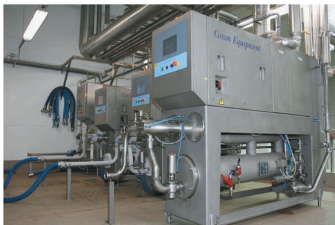
Zur Wahrung des kontinuierlichen Produktionsablaufs stehen insgesamt vier Freezer zur Verfügung; einer als Reserve