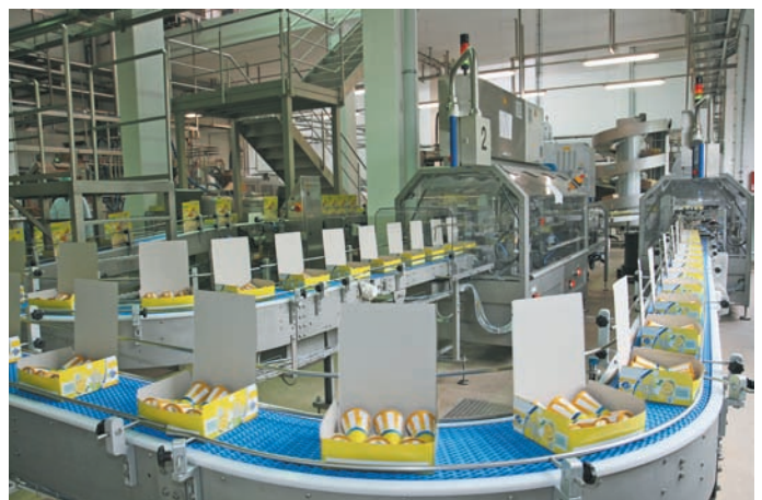
Die befüllten Verkaufseinheiten auf dem Weg zu den Karton-Verschließern

Füllköpfe, deren Anordnung variiert werden kann; zum Beispiel zweimal sechs oder viermal drei. Unmittelbar nach der Ventilabfüllung erfolgt – noch in der Station – das Verschließen der Tüten mithilfe von Pappdeckeln und das Umsetzen der Einheiten aus den Haltebechern in Lochplatten zum Weitertransport in den Froster. In diesem separaten, nur mit zwei