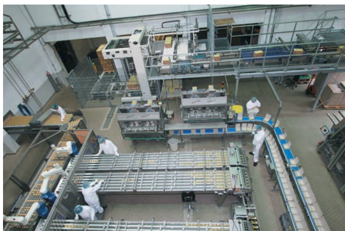
Teilansicht der neuen Waffeltüten-Anlage. Zu erkennen sind die Produktzuführung aus dem Froster (links oben), das Pick- und Kartioniersystem mit drei der insgesamt vier Roboter, die zwei Kartonaufrichter und dahinter die Endverpackungs-Sektion