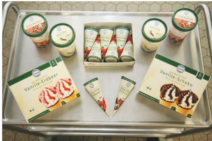
Auch Bio-Eis wird nun in Waffeltüten angeboten

Die durch die mechanischen Helfer realisierte vollautomatische Sortierung und Zuführung zur Verpackungssektion ist in wesentlichem Maß entscheidend für die außerordentliche Leistung der Gesamtanlage. Die Waffeltüten werden – in beliebiger Zusammenstellung bis zu drei Sorten gemischt – standardmäßig zu je sechs, aber auch zu acht oder zehn Stück in Faltschachtelkartons kommissioniert, die dop-